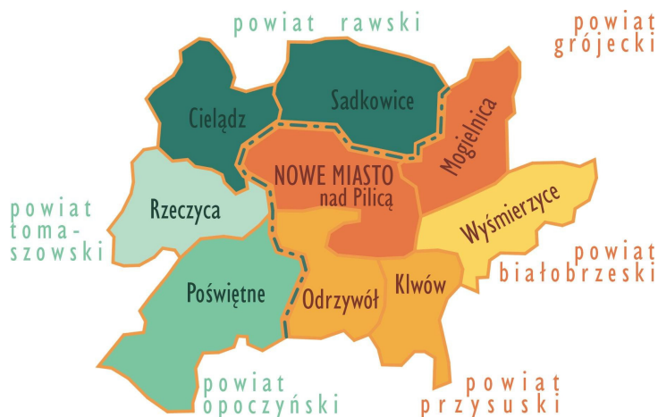
Rysunek 3. Gminy bezpośrednio sąsiadujące z Nowym Miastem nad Pilicą