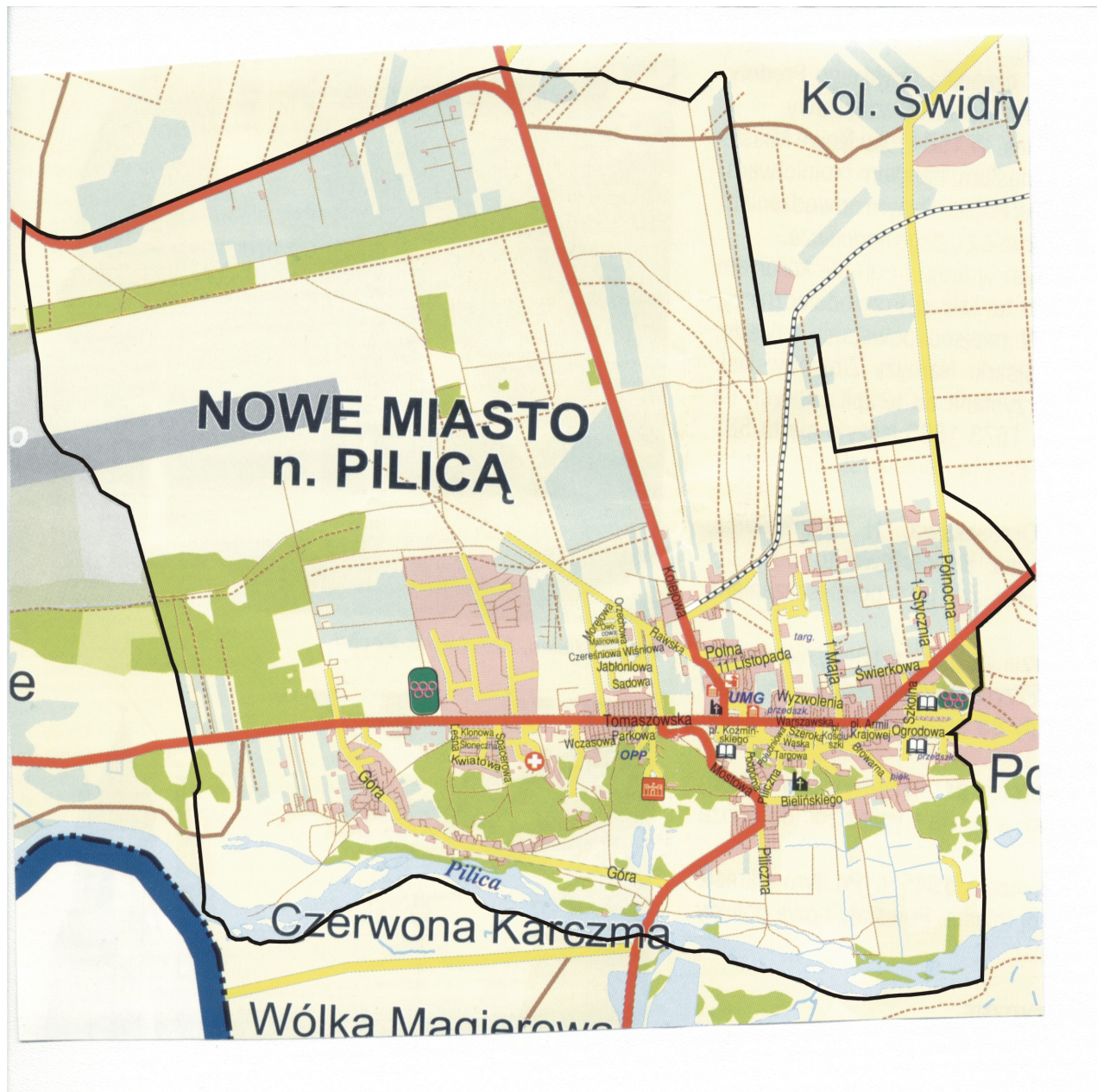
Mapa 1. Lokalizacja obszaru objętego Lokalnym Programem Rewitalizacji