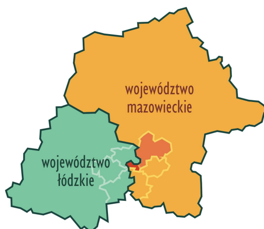
Rysunek 1. Położenie Nowego Miasta nad Pilicą na granicy dwóch województw: mazowieckiego i łódzkiego

na rycinie zaznaczono ciemniejszym kolorem powiat grójcecki, a w ramach tego powiatu – gminę Nowe Miasto nad Pilicą. Jaśniejszą linią zaznaczono sześć powiatów, z którymi graniczy Nowe Miasto.