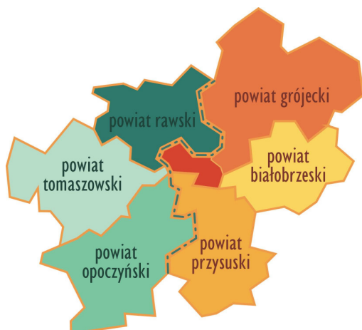
Rysunek 2. Powiaty graniczące z Nowym Miastem nad Pilicą

Źródło: Strategia rozwoju Miasta i Gminy Nowe Miasto nad Pilicą; w ramach powiatu grójeckiego ciemniejszym kolorem oznaczono gminę Nowe Miasto